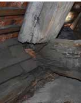
Teile des Dachstuhls sind morsch und müssen dringend sanieret werden

In Kürze soll nun mit den Arbeiten begonnen werden.