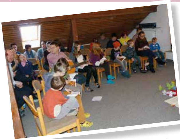
Gottesdienst in der Hauskapelle