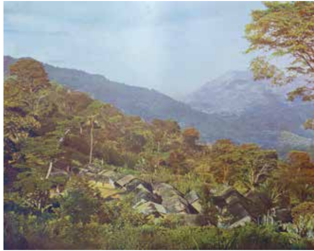
Hier wären die die Bamberger Gärtner gelandet: Ansicht aus den Usambarabergen, ca. 1920

jungfräulicher Boden noch in Menge des Eingriffes durch Pflug und Hacke harrt“ (S. 260). Gemeint waren damit Gebiete im heutigen Tansania. Es „würden unsere fleißigen Gärtner (...) der weitgehendsten Unterstützung des Reiches gewiss sein und bestimmt ihr gutes Auskommen finden“ (S. 297). Nebenbei wäre auch den Zurückbleibenden geholfen gewesen, weil diese ihre Anbauflächen hätten vergrößern können. Der Plan schlug unter den Gärtnern und in den Bamberger Zeitungen hohe Wellen.