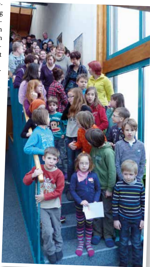
Die Treppe war zu klein für alle Teilnehmer