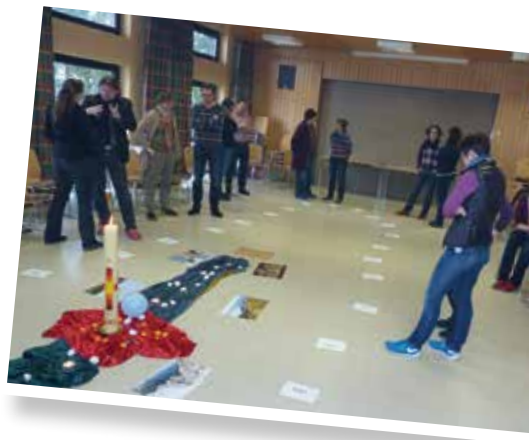
Bibelarbeit zu Hagar

unser eigenes Leben, angefangen bei Paulus und Thomas/Judas über David und Jakob bis hin zu Hagar und Hiob. „Ich hätte nie gedacht, dass man so offen und bewegend über unser Leben und unseren Glauben sprechen könnte.“ – so äußerte sich einer der Teilnehmer. Dass Raum für solche Gespräche blieb, war der Betreuung der zahlreichen Kinder durch die „Jugend“ zu verdanken. Und obwohl das Programm dicht gedrängt war (zumindest nach Ansicht des Vorbereitungsteams), stellte der neue PR Hubertus Lieberth nach der Reflexion verwundert fest: „Die wollen ja noch mehr Gespräche und Austausch. Das hätte ich jetzt nicht erwartet.“